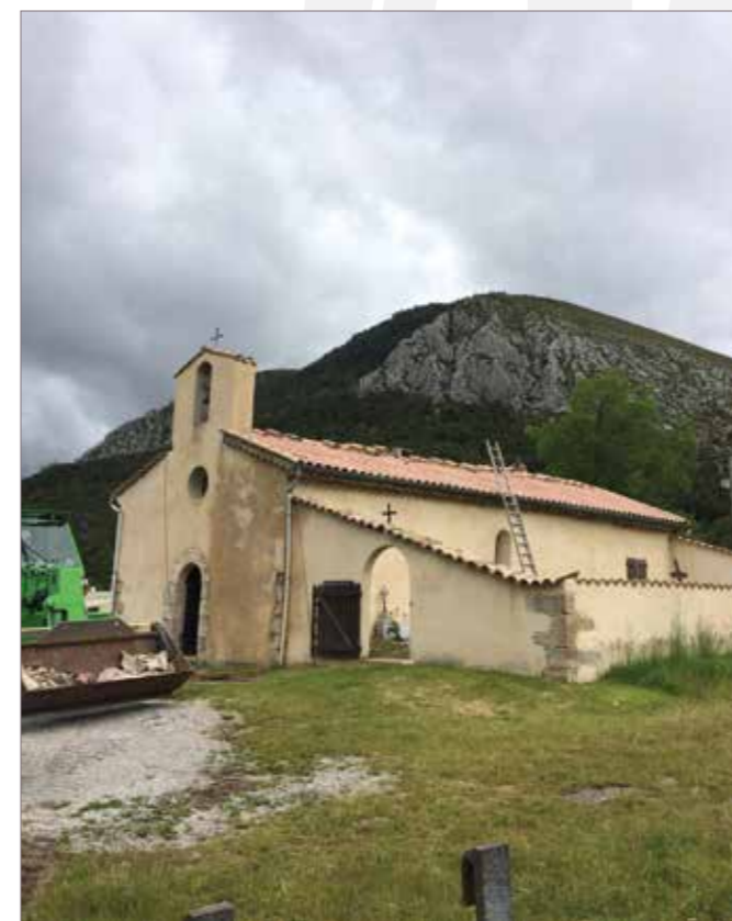
Toiture de la chapelle de Taulane