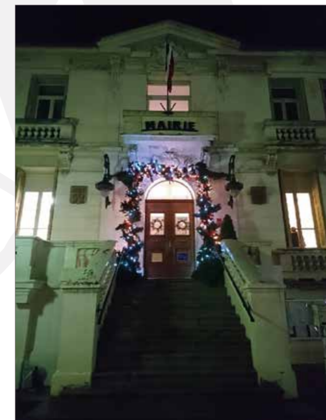
Fenêtre de l'avent