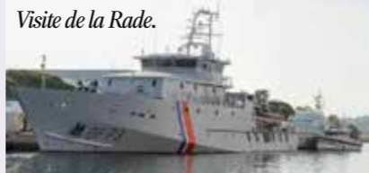
Une des sorties 2019 - Toulon Visite de la Rade.

CLUB DES AÎNÉS « CASTELLANE LA VAILLANTE » Boulevard Saint-Michel - 04120 CASTELLANE