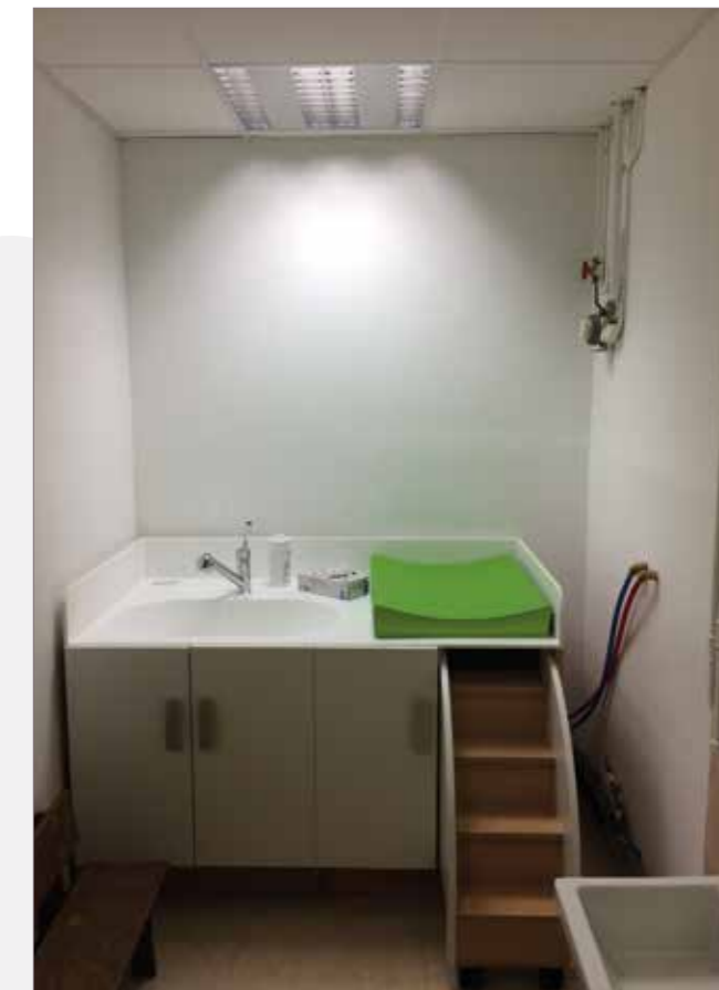
Table à langer à l'école maternelle