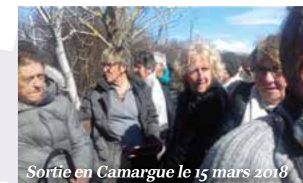
Sortie en Camargue le 15 mars 2018

La bonne ambiance, l'empreinte d'amitié et la quête de partage sont les ingrédients indispensables pour maintenir une association en bonne forme.